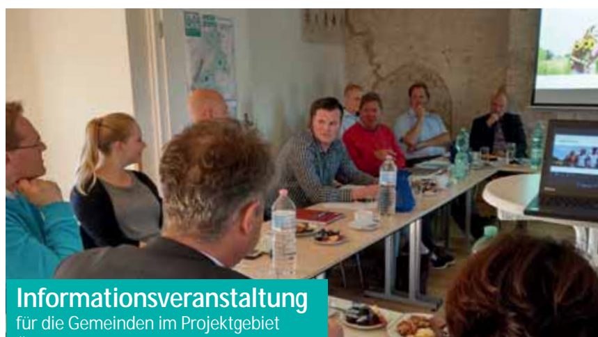
Informationsveranstaltung für die Gemeinden im Projektgebiet Östliches Umland von Neubrandenburg

Zur ersten Informationsveranstaltung trafen sich am 14. Mai 2019 Bürgermeister und Gemeindevertreter der Gemeinden Cölpin, Groß Nemerow, Holldorf, Neuenkirchen, Neverin, Pragsdorf, Sponholz, Staven und Trolenhagen auf der Burg. Zum Auftakt